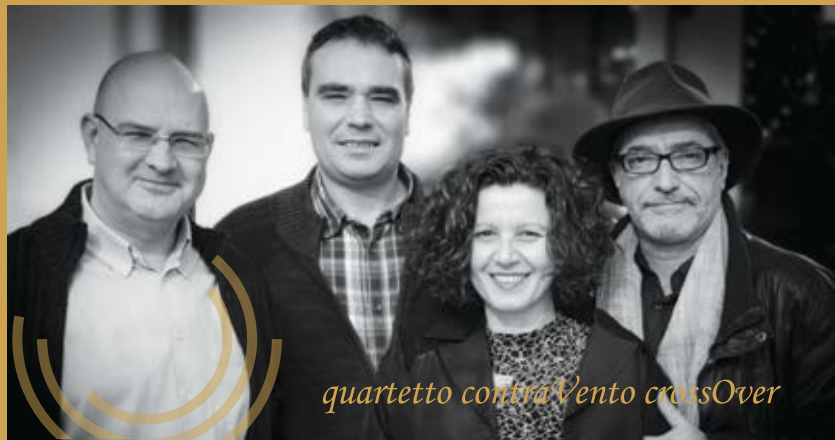
quartetto contraVento crossOver